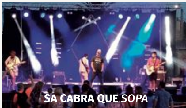
SA CABRA QUE SOPA