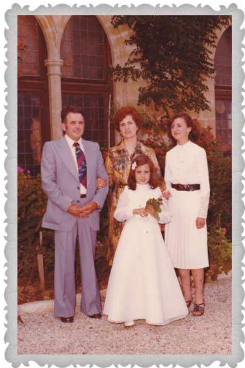
Toni de Son Canta, Ilucia i filles