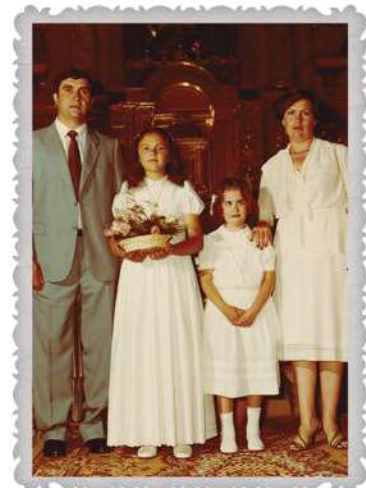
Familia Palou Reus