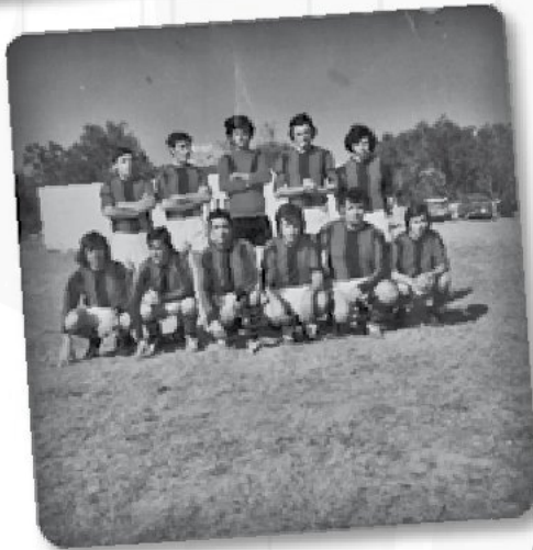
Equip de futbol Caimari any 1973