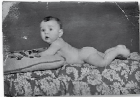
Pep (de Son Torrella)